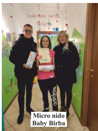
Micro nido Baby Birba

In occasione della Giornata internazionale per i diritti dell'infanzia, lunedì 20 novembre i bambini che frequentano gli asili nido e le scuole dell'infanzia di Ceriano Laghetto, hanno ricevuto la visita di una delegazione dell'Amministrazione comunale con la consegna di un piccolo omaggio. A tutti i bambini che frequentano gli asili nido operativi sul territorio comunale di Ceriano Laghetto, ovvero il Micronido Baby Birba, l'Asilo Nido Papaciotti, il Nido Famiglia Cresciamo Insieme, il Centro per l'Infanzia Pianeta Coccole di Vichi e l'Asilo Nido Gli Anatroccoli, è stato consegnato in dono un set di colori per le dita, mentre ai più grandicelli, dai tre ai sei anni, che frequentano le scuole d'infanzia, è stato donato un set di pastelli a cera. A tutti i bambini inoltre è stata donata una copia, colorata della poesia "Diritto di essere un bambino" di Madre Teresa di Calcutta. "Rilancio l'augurio che a nome di tutta l'Amministrazione