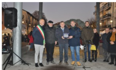
Sport: Club Tennis Ceriano