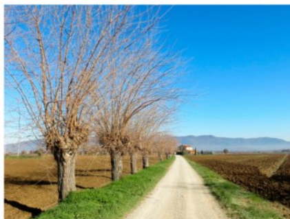
COMUNE DI CERIANO LAGHETTO