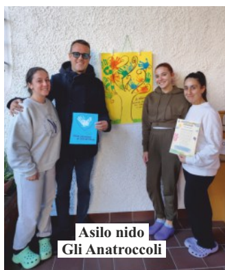
Asilo nido Gli Anatroccoli

comunale abbiamo voluto portare ai bambini in questa giornata speciale" – ha commentato la Consigliera comunale con delega all'Infanzia, Cristina Modesto. "Un augurio di cuore a tutti voi bambini e bambine affinché possiate germogliare e crescere circondati da amore, affetto e gioia, nel pieno rispetto dei vostri diritti" ha aggiunto l'Assessore ai Servizi Sociali, Dante Cattaneo. Alla visita negli asili nido e nelle scuole d'infanzia per la consegna dei doni ha preso parte l'Assessore all'Istruzione Dante Cattaneo, accompagnato nel pomeriggio dal Sindaco Roberto Crippa e dalla Giunta comunale al completo.