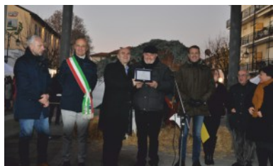
Attività produttive: Pg International Inox