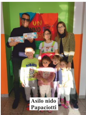
Asilo nido Papaciotti

In occasione della Giornata internazionale per i diritti dell'infanzia, lunedì 20 novembre i bambini che frequentano gli asili nido e le scuole dell'infanzia di Ceriano Laghetto, hanno ricevuto la visita di una delegazione dell'Amministrazione comunale con la consegna di un piccolo omaggio. A tutti i bambini che frequentano gli asili nido operativi sul territorio comunale di Ceriano Laghetto, ovvero il Micronido Baby Birba, l'Asilo Nido Papaciotti, il Nido Famiglia Cresciamo Insieme, il Centro per l'Infanzia Pianeta Coccole di Vichi e l'Asilo Nido Gli Anatroccoli, è stato consegnato in dono un set di colori per le dita, mentre ai più grandicelli, dai tre ai sei anni, che frequentano le scuole d'infanzia, è stato donato un set di pastelli a cera. A tutti i bambini inoltre è stata donata una copia, colorata della poesia "Diritto di essere un bambino" di Madre Teresa di Calcutta. "Rilancio l'augurio che a nome di tutta l'Amministrazione