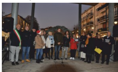
Sociale: Comitato Genitori