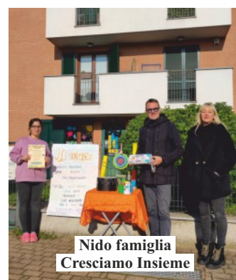
Nido famiglia Cresciamo Insieme