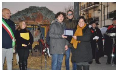
Commercio: Griglieria Raffaele