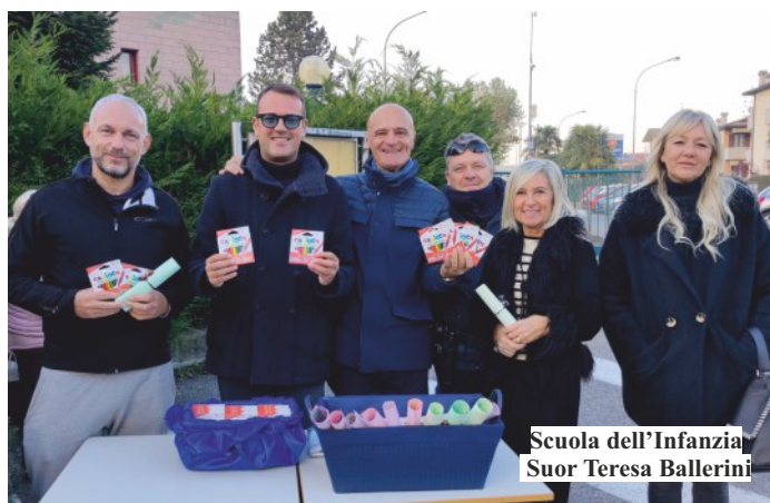
Scuola dell'Infanzia Suor Teresa Ballerini