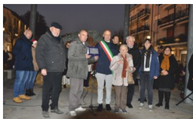
Cultura: Circolo Storico Cerianese