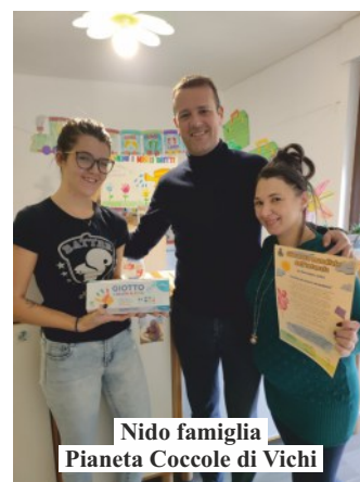
Nido famiglia Pianeta Coccole di Vichi